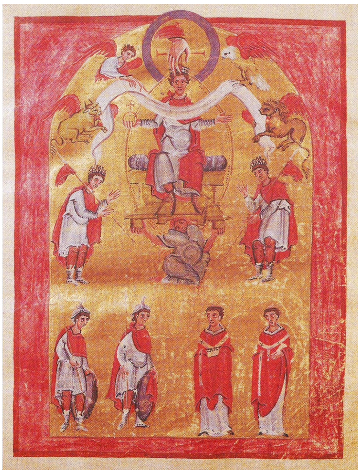
Otonas III – Christomimesis , Reichenau, Otono III Evangelijų knyga apie 1000 m.

Geriausiai tokią sampratą buvo įkūnyta Otoną III vaizduojančioje miniatiūroje, kur imperatorius pavaizduotas kaip Dievo vietininkas žemėje ir beveik susitapatinamas su pačiu Dievu (žr. 1 pav.).