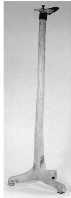
Žibinčius (žibinčiaus kojos – natūraliai išaugusios medžio šakos). XIX a.

Atsiradus žibalui, plinta spingsulės – žibalinės lempelės be stiklo. Jas zanavykai vadino labai įvairiai: spingos , spingsos , spangės , spingsiukės , spingsuolės , spingsutės , spingsytės , spingsulės , lemputės . Spingsulės buvo fabrikinės gamybos bei vietos žmonių pasidirbtos. Lengviausiai spingsulė pagaminama iš mažo stiklinio buteliuko, ypač nuo rašalo. Jo viršuje įtaisomas specialus skardinis kamštėlis su apvalia skylė dagčiui ( knatui ) iš namų darbo storo lininio ar pakulinio audinio arba laisvai susukto lininio ar pakulinio pluošto. Taip pat spingsules pagamindavo