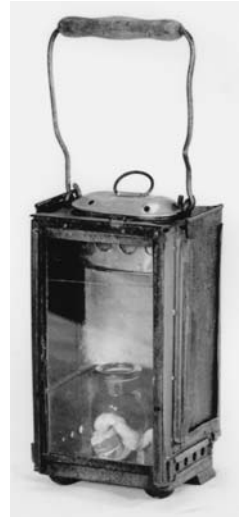
Žibintas fabrikinės gamybos su viduje įstatoma lempelė be stiklo

Žibalinių lempų, lempų stiklų, žibalinių žibintų ir jų stiklų bei žibalo dažniausiai pirkto Griškabūdžio krautuvėse. Žibalinės lempos kainavo tris penkis litus, jų stiklai – vieną litą, kurie vėliau atpigo iki septyniasdešimt šešiasdešimt centų. Vienas litras žibalo kainavo apie keturiasdešimt penkiasdešimt centų. Kai kuriuose kituose Lietuvos regionuose žibalas buvo brangesnis. Prisiminkime, kad dešimt kiaušinių tada kainavo apie vieną litą (nuo 70 ct