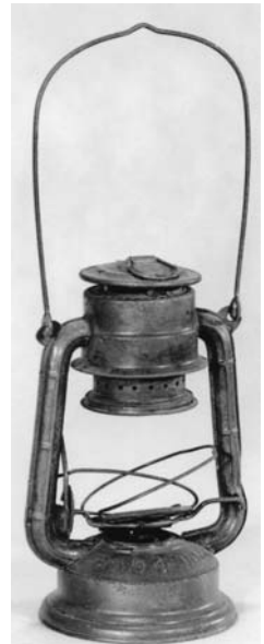
Žibintas, žibalinis, fabrikinės gamybos. XX a. 3–4 dešimtme.