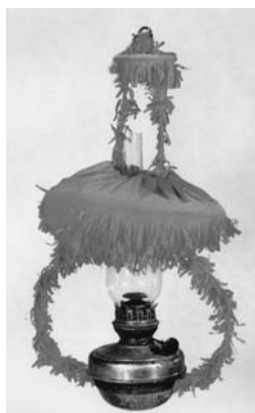
Pakabinama prie lubų žibalinė lempa su stiklu