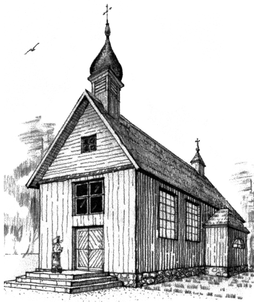
Šiupelių bažnyčia. Pagal 1788 m. inventorių. Algio Knyvos hipotetinė rekonstrukcija

Bažnyčios šventorių juosė tvora: iš trijų pusių – žiogrių, iš priekio – basliukų, su įėjimo vartais. Šventoriaus kampe ant atramų stovėjo varpinė, kurios lentelėmis