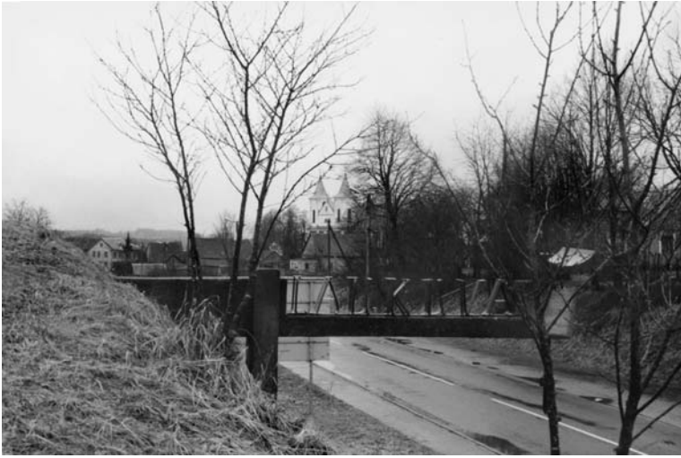
Įvažiavimas į Laukuvos miestelį iš Žemaičių plento. 2001 m.

įstatymo priėmimo. Pagal apklausą tuomet jų buvę tik keturi. 1990 m. ūkininkauti pradėjo 6, 1991 m. – 4, 1992 m. – 5. Vėliau ūkininkų skaičius vis didėjo.