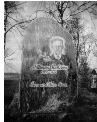
Paminklas Antanui Radžiui (1923–1946) Druckūnų k. kapinėse, Varėnos r.