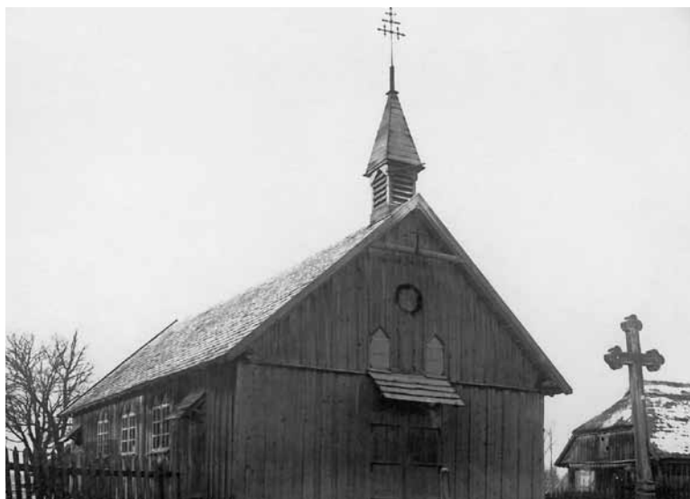
1 pav. Laikinoji Gardamo bažnyčia – „šopa“.