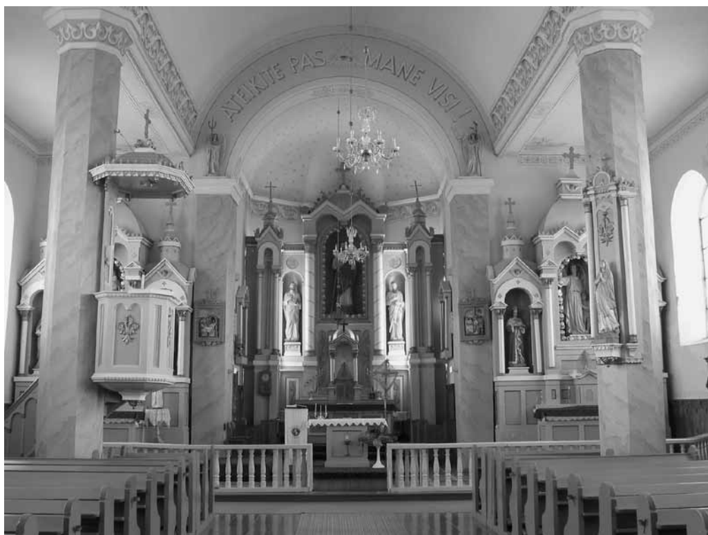
12 pav. Bažnyčios interjeras. 2003 m.

Bažnyčios erdvė pseudobazilikinė: cilindrinis skliautus perdengta didžioji nava yra aukštesnė už šonines. Nuo pastarųjų ji atskirta keturiais pilioriais – du transepto pilioriai yra aštuoniakampio plano, kita pora – keturkampiai stulpai. Choro tribūną laiko dar dvi kolonos. Du piliastrai, ant kurių kapitelių stovi po angelo statulą, remia presbiterijos triumfo arką. Jos centre nupiešta Apvaizdos akis išterpia į užrašytą invokaciją: „ATEIKITE PAS MANE VISI! Mt 11,28“.