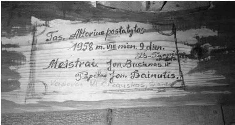
15 pav. Įrašas šoninio altoriaus mensos vidinėje pusėje.