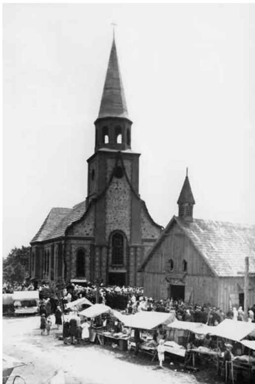
5 pav. Laikinoji ir naujoji Gardamo bažnyčios. XX a. 4 deš. Fotografas nežinomas. Iš Z. Malinausko albumo