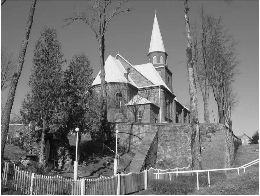
6–7 pav. Gardamo bažnyčia. 2003 m.

liejus – Jėzaus mirties metinės, taip pat minėtas ir Apreiškimo Lurde 75-metis, kėlęs naują lurdų statymo bangą Lietuvoje. Galbūt šie jubiliejai tapo akstinu atsirasti Gardamo lurdui.