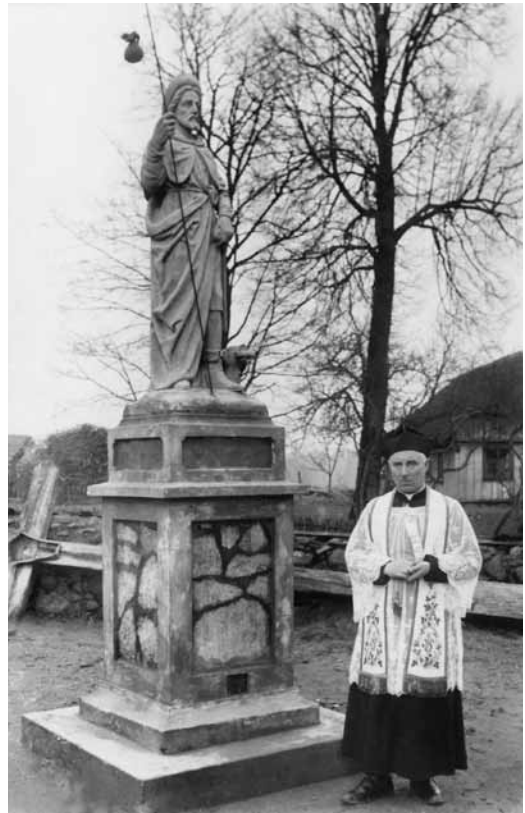
10 pav. Skulptūra „Šv. Rokas“ ir kun. [S. Ignatavičius]. [1933].

Pagrindinis bažnyčios fasadas yra plokščias, suporinti piliastrai vertikaliai dalija jį į tris plokštumas, tarp kurių vyrauja į viršų kylanti stačiakampė bokšto plokštuma. Piramidiškai išdėstyti trys arkiniai fasado langai irgi pabrėžia kompozicijos vertikalę. Apskritoje išėmoje bokšto viršuje 2002 m. įmontuotas laikrodis, analogiškos išėmos-pseudolangai yra ir šoniniuose fasaduose. Vieninteliai įmantresni elementai – stilizuotų voliutų siluetą turinčios šoninės pagrindinio fasado plokštumos, „remiančios“ aiškių ir paprastų formų bokštą. Tiek voliutos, tiek daugelis bažnyčios sienų viršuje puoštos laiptuoto profilio karnizais su dentikulų (dantukų) ornamentu. Savotiškai šį ornamentą atkartoja ir į vertikalias raudonų plytų juostas įterptų akmenų ritmas. Pastatui grakštumo teikia virš bokšto kylantis mažesnis šešiakampis bokštelis su skardos smaile ir metaliniu kryžiumi. Kiekvienoje bokštelio sienoje yra po arkinį langą. Po šešis arkinius langus išdėstyta šoniniuose bažnyčios fasaduose. Du arkiniai langai apšviečia presbiteriją, du stačiakampiai – zakristijas, o du maži arkiniai langeliai iškirsti galiniame bažnyčios frontone.