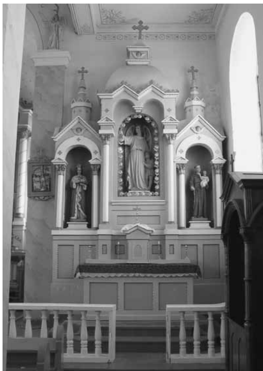
14 pav. Šoninis Šv. Angelo Sargo altorius. 2003 m.

Šoniniai altoriai – Švč. Mergelės Marijos titulo moterų pusėje ir Šv. Angelo Sargo titulo vyrų pusėje – pastatyti 1958 m. Jie yra paprastesni (14 pav.), maždaug metru žemesni už didįjį altorių. Jų išvaizda, kaip minėta, derinta prie didžiojo altoriaus. Savo kompozicija altoriai atkartoja didžiojo formas, ypač centrinę jų dalis su dvilype arka