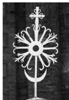
9 pav. Šventoriaus tvoros kryžius. 2003 m. V. Balčyčio nuotr.

Nuo didžiųjų bažnyčios durų žvelgiant į šventorių, dešinėje stovi maždaug 3,4 m aukščio paminklas šv. Rokui (skulptūros h – 1,85 m). Šis šventasis populiarus visoje Lietuvoje, bet ypač Žemaitijoje. Batakių, Varsėdžių, Kražių bažnyčių šventoriuose pastatytos šv. Rokui skirtos koplytėlės, Gardame – paminklas. Gardamiškių patronas – piligrimų, sergančiųjų užkrečiamomis ligomis, taip pat ir gyvulių globėjas. Šventojo veikla atspindėta paminklo skulptūros ikonografijoje, o ji įprasta (panašios ikonografinės atributikos yra ir Švėkšnos šventoriaus koplytėlėje esanti šv. Roko statula). Gardamo Rokas (10 pav.) pakėlęs apsiaustą rodo savo kojos žaizdą, o kita ranka remiasi į ilgą keliauninko lazdą, ant kurios pritvirtintas nedidelis maišelis (mašna). Prie kojų guli šunelis, gelbėjęs šventąjį nuo bado, – nasruose jis paslaugiai laiko duonos kepalėlių. Rokas dėvi kelioninę aprangą – skrybėlę, ilgą apsiaustą.