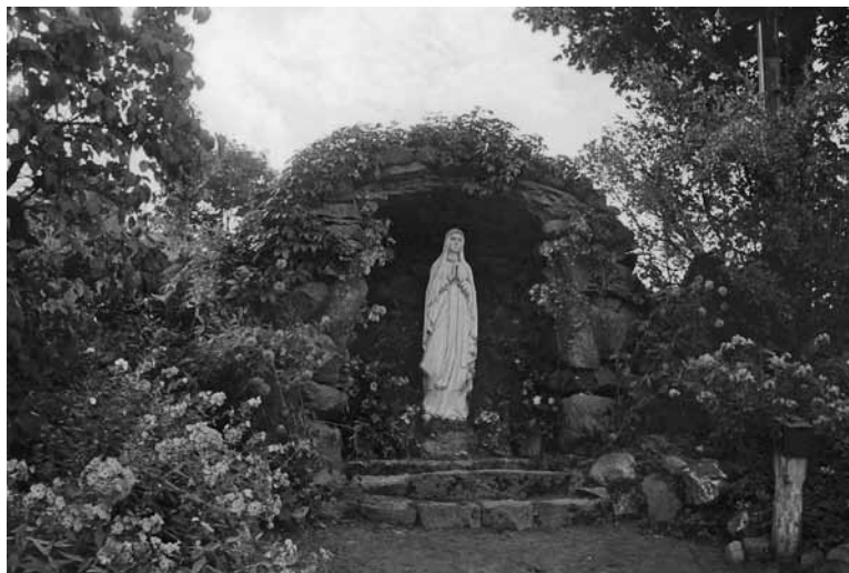
8 pav. Gardamo Lurdas. 1936 m. KPCA

Nuo lurdo pusės senoji šventoriaus akmenų tvora sustvirtinta keliais kontraforsais. Anksčiau palei šventoriaus tvorą būta iš akmenų sumūrytų Kryžiaus kelio stočių koplytėlių. Dabar dalį šventoriaus juosia nauja akmenų tvora, o priešais pagrindinį bažnyčios fasadą tvora sumūryta iš silikatinių blokelių. Mūriniai didžiųjų vartų ir šoninių vartelių stulpai viršuje papuošti šviesiai dažytais metaliniais kryžiais (h 0,61–0,65 m, h 0,31–0,35 m). Tai modernesni tradicinių metalinių mažosios architektūros viršūnių pavyzdžiai (9 pav.). Kryžių kryžmos vietoje yra kiauraviduris skritinėlis, prie kurio prikiedyti įvairaus piešinio išcentriniai spinduliai, tarp kurių išryškėja kryžiaus forma. Šventoriaus vartus puošiančių kryžių spindulių gloriijos kompozicijos nesikartoja, yra originalios, kai kurios – išraiškingo silueto. Visų kryžių struktūroje vyrauja vertikalės: jos pailgintos ir viršuje užbaigtos skirtingai dekoruotomis perkryžomis. Visur stiebo apačioje ragais į viršų, kaip įprasta liaudies dailėje, pritvirtintas (ar buvo pritvirtintas) mėnulio pjautuvas. Minėti kryžiai ir didžiųjų bažnyčios vyrių puošmenos – vingrūs stilizuoti augaliniai ornamentai – sudaro įsidėmėtiną kalvystės objektų ansamblį.