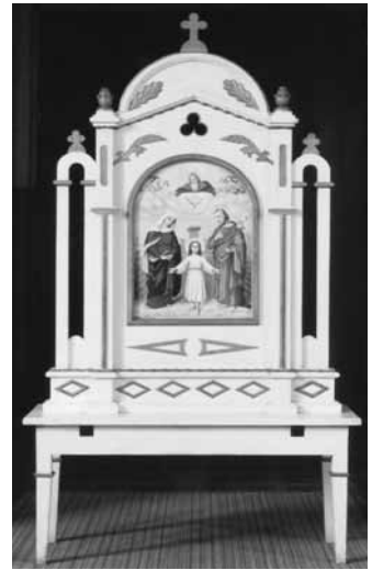
16 pav. Procesijų altorėlis su paveikslu „Šv. Šeima“. 2003 m.