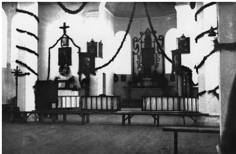
11 pav. Bažnyčios interjeras. XX a. 4 deš. Fotografas nežinomas. Iš Z. Malinausko albumo