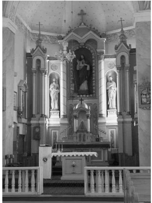
13 pav. Didysis altorius.

Nepavyko išsiaiškinti, kada pastatytas didysis – Švč. Jėzaus Širdies titulo altorius (h su kryžiumi ~8 m). Tikėtina, kad jis sumeistautas ketvirtajame dešimtmetyje, galbūt 1933–1935 metais (tikrai jau buvo 1948 m. 25 ). Altorius užima visą apsidės plotį, yra laužyto plano, erdviškai išplėtotas (13 pav.). Jis vieno tarpsnio, su aukšta postamentine dalimi. Kaip anksčiau buvo įprasta, tabernakulis yra altoriaus centre, virš mensos. Jis dviejų aukštų. Apatinė